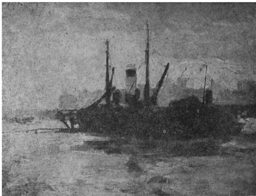
Stipan Kopilović: Hajó a Szajánán, 1908. (fotó: A. J.) A Városi Múzeum anyagából.

formát. Két kiállított nagyméretű vászna, de különösen A háború látomása nagyvonalúan megoldott festői produkció.