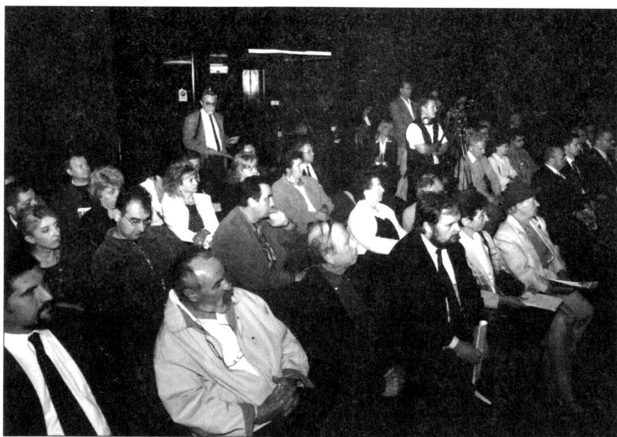
A tanácskozás közönsége