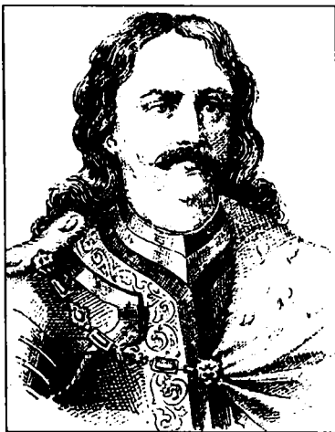
Hunyadi János/Sibinjanin Janko

Állapítsuk meg tehát záradékol, hogy a két pápa, III. Calixtus és VI. Sándor volt a törökellenes harangozás elrendelője; az első egyik bullájában, a másik e bulla alapján kiadott szentszéki rendeletében. E történeti tények egyáltalán nem kisebbítik Hunyadi és Kapisztrán fényes nándorfehérvári haditettének súlyát és jelentőségét, a déli harangszó győzelmükhöz nemesedő félezer éves hagyománya ugyanis annak bizonyítéka, hogy az emlékezet évszázadokig, még a közbeeső másfél évszázadnyi török hódoltság ideje alatt is, számon tartotta a győzedelmes csata tényét.