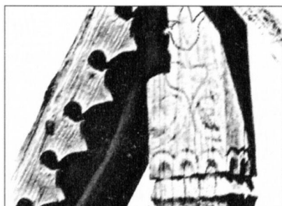
A felvételek A faragott fa emlékére című film anyagából készültek

Az egykori keresztek, hogy az időjárás viszontagságaitól valamelyest védve legyenek, fedettek voltak. Ezáltal a nagyobb felületen több lehetőség nyílt a díszítéshez is. Így a borítóléc elülső és hátulsó oldalára, fűrészelt fogazattal díszített, vagy hullámvonalas lyuggalt lapot erősítettek.