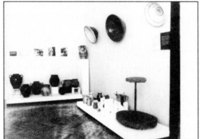
Az állandó néprajzi kiállítás halászati része

A kiállított tárgyak nagyobb része eddig szabadon, nem üveges vitrinben állt. A kiállítás felújításával, a szakszerű feliratozással, az esztétikus látvánnyal ezúttal a néprajzi tárgyak korszerű szakmai feldolgozásának eredményét szeretnénk hangsúlyozni. Egyúttal a tárgyak életét is szeretnénk meghosszabbítani a tisztítással, az újrakonzerválással, az új vitrinekbe való helyezéssel.