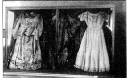
Régi néprajzi kiállítás részlete