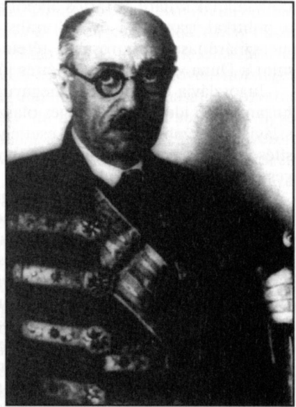
Teleki Pál miniszterelnök