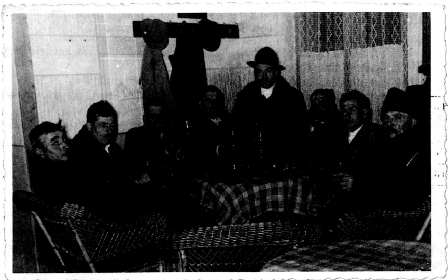
Búcsúkor a doroszlai parasztek szívesen kocsmáztak, és az ivószobában társalognak (1958)

De az igazi mulatság csak ezután kezdődött. Mókára hajlamos legények borgőzös fejjel, heccből fölkiérték móvatáncra , meg sorra hamvazták a szájatátó öregasszonyokat. Egyikük vizet fröcskölt, a másik hamut szórt a pendelyük alá, mondván: porból lettél, porrá válsz! Harangszót sem várva, alaposan meghamvazták azt, akire nehezteltek.