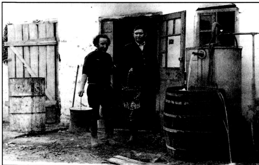
Doroszlói kazánház pálinkafőzéskor (1977)

Jellemvizsgálat. Egyéves korában pénzt, bort meg könyvet helyeztek a gyerekek elé, mert amelyikért nyúl, azt fogja kedvelni egész életében.