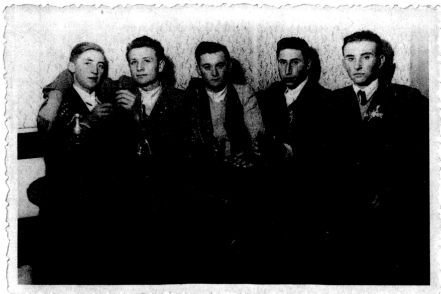
Italozó lakodalmas legények (1954)

Azáltal, hogy a vendéget vele kínálták, a bor tekintélyt kölcsönzött a háznak. Ahol meg étkezéskor borosüveg állt az asztalon, ott aztán nem volt híján a mód sem.