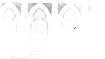
Balassy Gyula (zentai kántor)