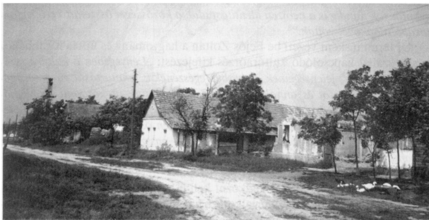
Hódegyháza utcaképe elhagyott, pusztuló házakkal (2002)

érdeklődésének homlokterébe, mind Magyarországon, mind pedig nemzetközi viszonylatban. 2