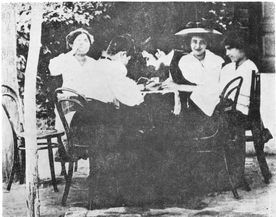
1906 nyarán a Miklós utcai ház udvarában