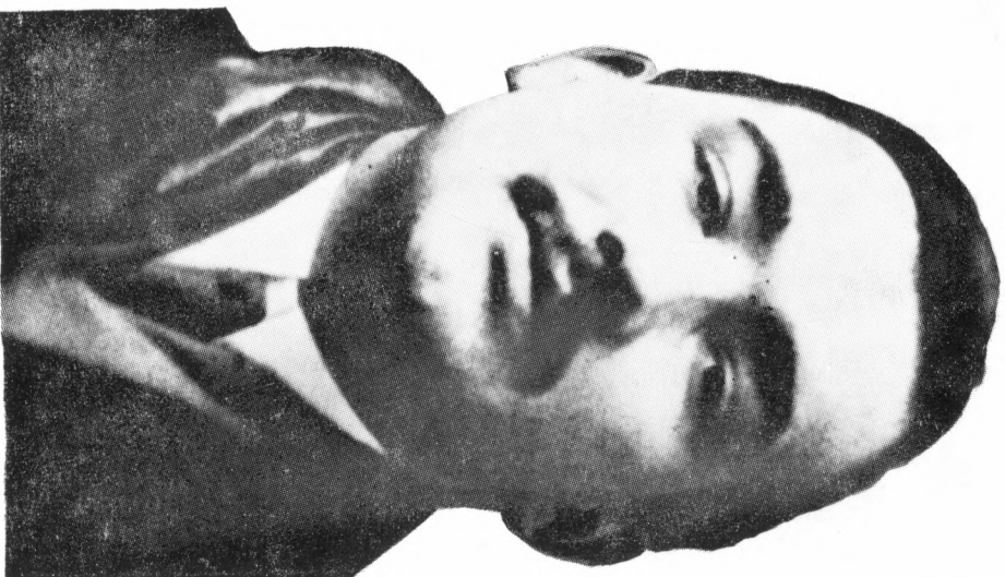
A sikeres író (1910)