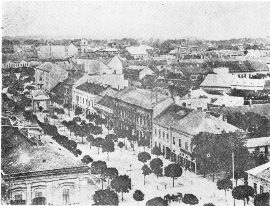
Szabadka a századforduló idején