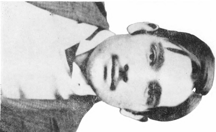
A negyedéves orvostanhallgató (1908)