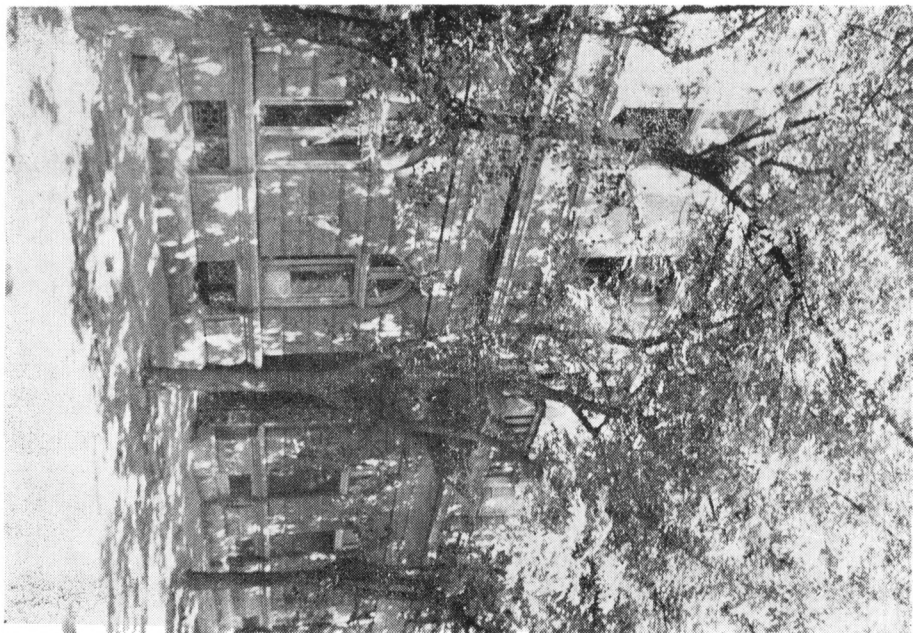
A szülői ház