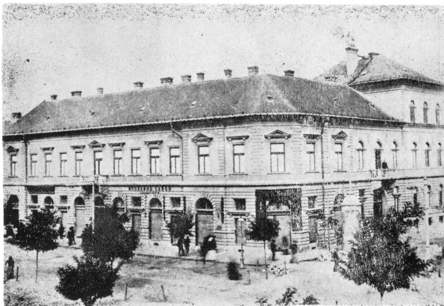
Itt élte le gyermek- és ifjúkorát