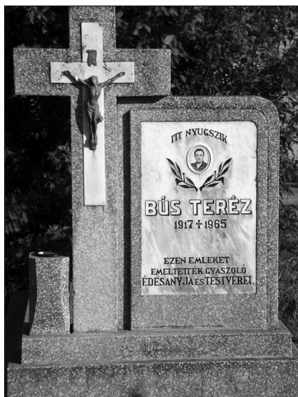
Műkő síremlék, márvány betéttel (Nagytemető, 2013. Fotó: K. Z.)

Ezek a lassan szaporodó kövek fokozatosan kezdték uralni a temetői teret, ám az urbánus sírkert kialakulásához a döntő lökést a műkő megjelenése adta. Olcsósága és tartóssága révén folyamatosan sokasodott azoknak a síroknak a száma, melyeket ebből az anyagból „csináltattak fel”.