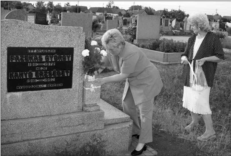
Lakodalmi virág kitűzése az elhunyt hozzátartozók sírjára (Nagytemető, 2004.)

Nincs tehát az a fajta elidegenedés és elhatárolódás a város katolikus lakosságának körében, mint ami a nem hívőket jellemzi.