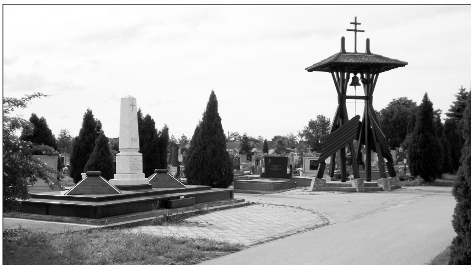
Az 1944-es emlékmű és az új harangláb (Nagytemető, 2013. Fotó: K. Z.)

A lokális identitásnak újfent fontos elemeivé váltak tehát a múlt és közelmúlt szereplői, elszenvedői. A város temetőiben a 19. században már a sorbatemetés rendje szerint történtek az elhantolások. A temetés után hat hétre lehordják a sírról a koszorúkat, a szalagokat viszont, melyeken az utolsó üzenetek vannak, a keresztekre kötik. Ekkor misét mondatnak a halott emlékére, amire összegyűlik a rokonság, a barátok és ismerősök. Hat hónappal később ismét misét mondatnak, és mise után kimennek az