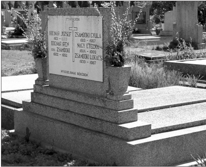
Húsvéti barka a sírokon (Nagytemető, 2012. Fotó: K. Z.)