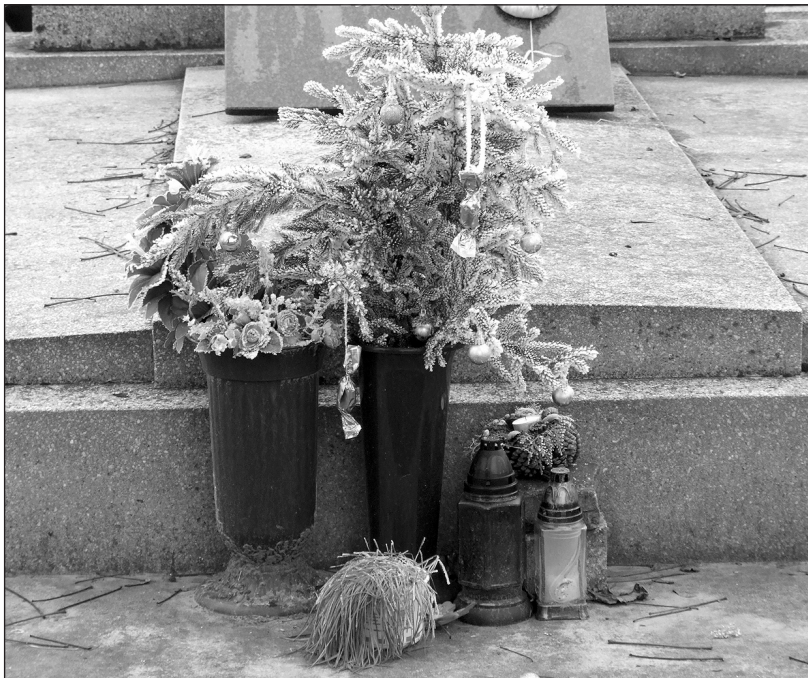
48 Karácsonyi fenyőág gömbökkel, szaloncukorral (Nagytemető, 2013. Fotó: K. Z.)