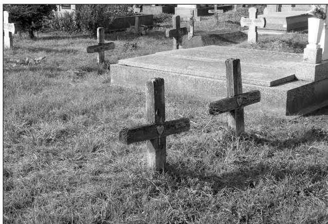
A falusi temető maradéka: fakeresztek (Nagytemető, 2008.)