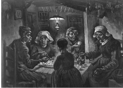
Vincent van Gogh: Krumplievők , 1885

az evés ínsége is. Krumpli és só, rágás és nyelés: az anyagi létezés nagy csábítása, az érzékiség, az ízek élvezete sehol, apa és lánya úgy esznek, mint ha kötelességet teljesítenének. A filmben ez szárazon, banálisan, ezerszer hallottan ki is van mondva: a hatodik napon, amikor a lány már nem nyúl a krumplijához, az apa nyersen rászól: „Egyél. Enni kell.”