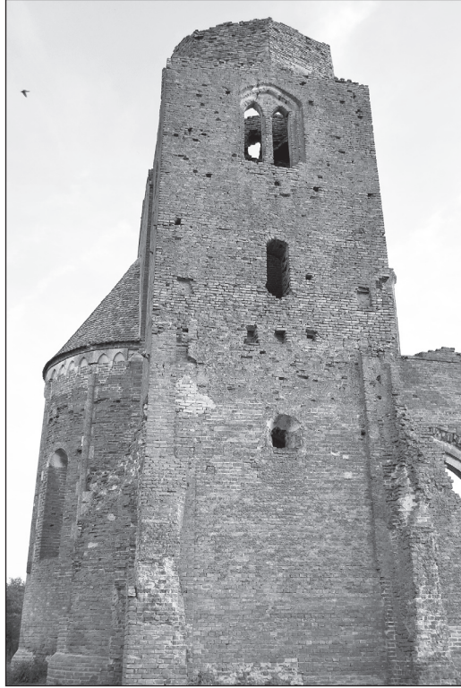
A torony északról

ablakos szintje miatt kápolnaként kerül meghatározásra? 22 Ugyanakkor igen figyelemreméltóak az ásatásokról készült pillanatképek és a rekonstrukciós munkák közbeni állapotot bemutató fotók. 23