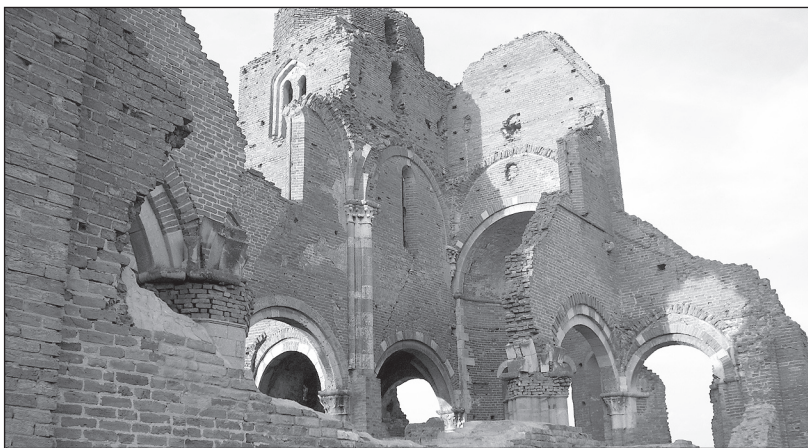
A romok délnyugatról

dolni, hanem arra, hogy a kő mesterének tanultságát nem csak a Dombón tevékenykedők határozták meg. Mindezek az összefüggések azt is jelentik, hogy az aracsi kő valamikor 1100 körül készülhetett. 38 És azt is, hogy a kő segítségével a korábbi templom nyugati részének periodizációját nem lehet elvégezni. Kérdés marad tehát, hogy ha valóban létezett a nyugati torony, az együtt épült-e a templom többi részével, vagy valóban utólagos bővítésről van-e szó. Mivel továbbra sem igazolható minden kétséget kizárva, hogy a kő aracsi megrendeléssel függ össze, kérdés, hogy a kő datálása segítségével a régebbi templom bármelyik része datálható-e.