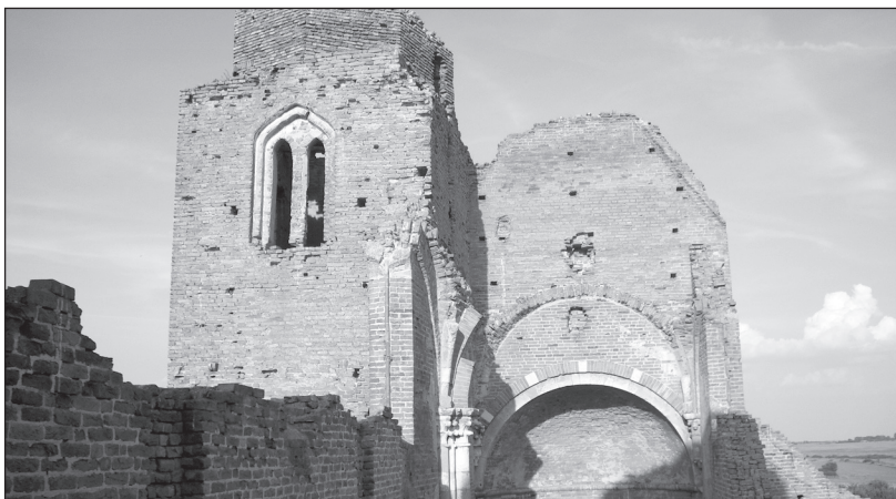
A torony nyugatról

Ezek a rendszerek ugyanis nemcsak szerkezetileg-statikailag alkottak összefüggő egészet, de feltételezhetően művészeti összefüggéseik és eredetük is azonos. Könyvemben is idéztem már Vercelli San Andrea templomának példáját, amely esetében a bourges-i gótikus székesegyházhoz köthető boltozattartó és faltagoló megoldásnak az aracsihoz részben hasonló származékával találkozni. 55 A támfalak Vercelliben és Aracson is a gótikus támvégeknek a tégláépítészet lehetőségeihez alkalmazott változataiként értelmezhetőek.