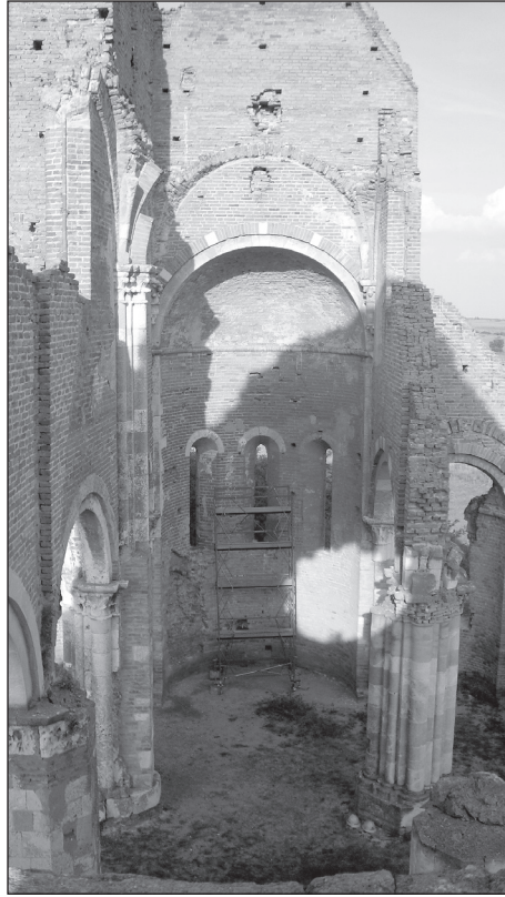
A főhajó kelet felé

kizáló kompozíciójú, amely kompozíciót akantuszszármazékok és figurális formák alkotnak. A féloszlopfői rész tengelyében álló figurát Stanojev a görög mitológia Atlasz aként határozta meg, a mellékfigurát pedig annak egyik lányaként. 66 Bő a választék: Atlasznak jó néhány lánya volt. Stanojev, bár nagy a fantáziája, a választást az olvasóra bízta. Nos, a figurák azonosításához nincs támpontunk, a meghatározások így önkényesnek hatnak. A fő figura persze valóban atlaszszerepű: az abakuszt és a vállpárkányt látszik tartani, általa pedig az épület felsőbb részeit is, mint az épület foglya/alárendeltje. A jobb oldaliról (a fő figurához képest bal oldali) is csak ennyi állítható: arcát a tenyerébe hajtja, ami általában a szomorúság jele. Érdekesebb és tanulságosabb is az atlaszszerepű figurának a kompozíciós környezetével együtt való vizsgálata, amely vizsgálat Provence XII. századi antikizáló művészetével való kapcsolat lehetőségére irányítja a figyelmet – az enyémet mindenképp. 67