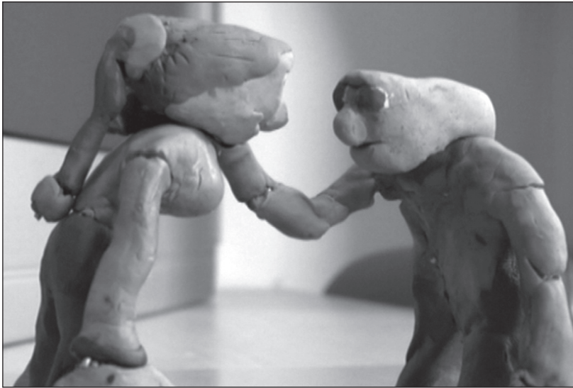
Részlet a Kicsi Klájd és a Nagy világ 2 című alkotásból