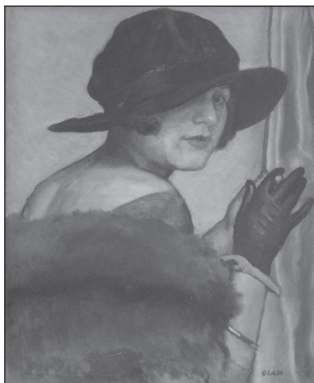
Oláh Sándor: Feleségem arcképe (1920)