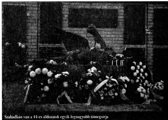
Szabadkán van a 44-es áldozatok egyik legnagyobb tömegsírja

Szerbia még nem tart ott, hogy a bünsőket is felelősségre vonja. Már az is nagy lépés, hogy a rehabilitációs és a kárpótlási törvény jogerőre lépésével lemoshatják a vételek magukról a gyalázatot, és visszakövetelhetik az elvett, becsületüket