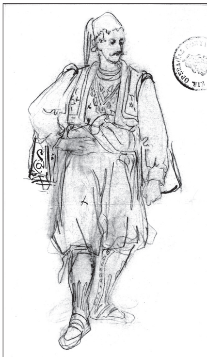
Stevan Todorović: Szerb polgár , 1867 (?)