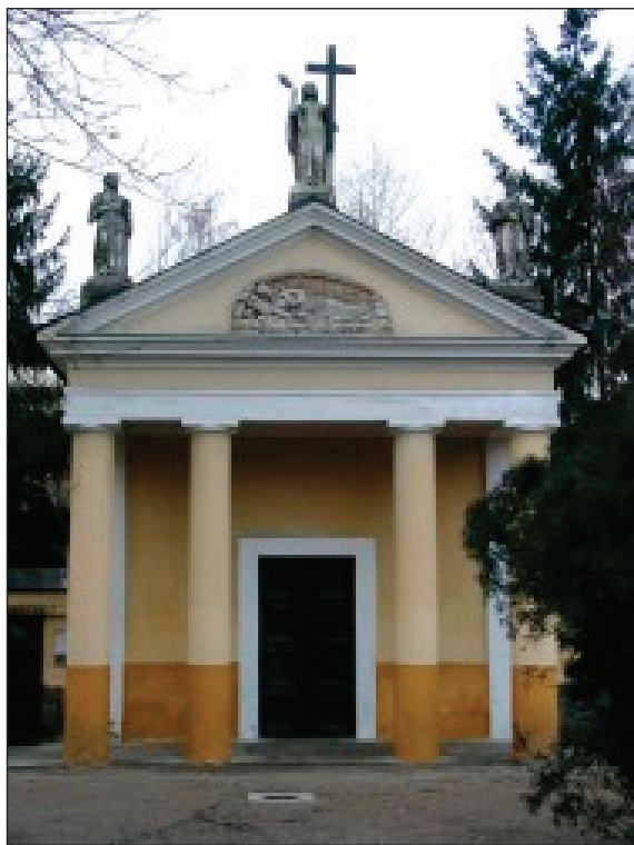
A jászberényi Szent Rozália fogadalmi kápolna

Keywords: plague epidemics, Saint Rosalia cult, Jászapáti, resettlement, Temerin