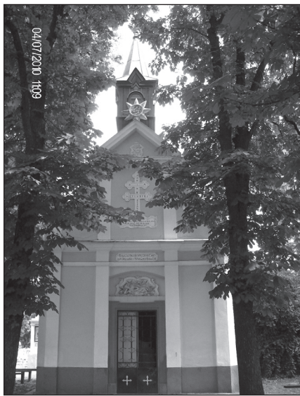
A jászapáti Szent Rozália-kápolna