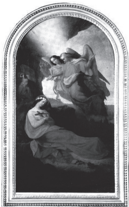
A temerini plébániatemplom oltárképe