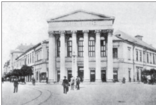
A Pest Szálló épülete, a kiállítás színhelye