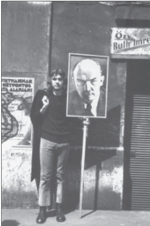
Szombathy Bálint: Lenin in Budapest

lehetne ragasztani, és megközelítési módok tömegével dekódolni, hogy a sok szöveg agyonnyomná magát a művet, a gesztust, a lényegét, s ennek Art Lover biztosan nem örülne.