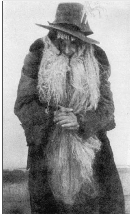
Zsidómaszkos alakoskodó, Panyola, 1958, farsang

A középkor során és később is, Rómában nagycsütörtökön vagy nagypénteken tarka maszkos felvonulásokat tartottak, melyeknek főszereplője a zsidó figurája volt. E római szertartások képezték a mintát és példát Ragusa városának bárdolatlan köznépi lakossága számára is. A rómaiak a zsidót megjelenítő figurát ökrösszekérre állították, a szekeret a város utcáin végighúzva a szereplőt fojtogatták, „felakasztották”, s mindenféle egyéb módon kínozták, mígnem a halál valamely szégyenletes módján ki nem múlt. A