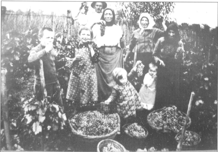
643 Bei der Weinlese