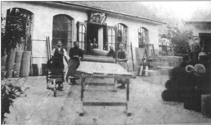
958 Drahtverarbeitung (Aufn. 1928)