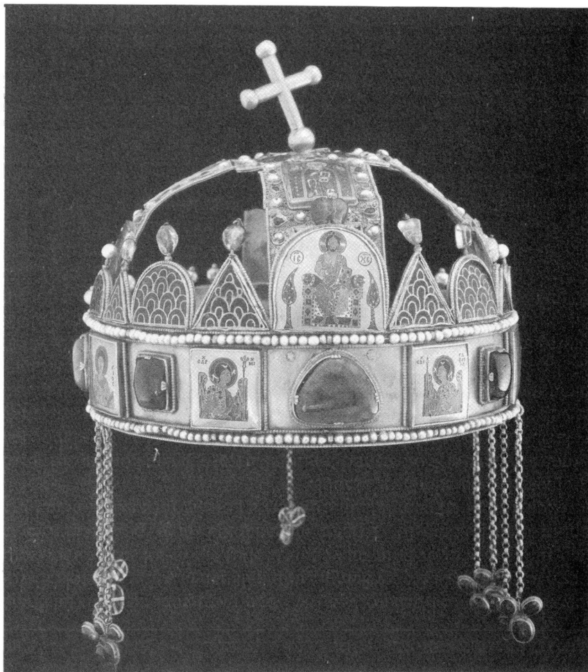
A Szent Korona

mely a magyar népi hiedelemben azonos az Északi Sarkcsillaggal. Ez a csillag a Földtől ezer fényévre van, forgástengelye, amint azt a „sarkcsillag” elnevezése is jelzi, éppen feléje mutat. A forgástengely hajlásszöge a földpálya síkjához 66^{\circ} 33' , de ez nem változatlan érték. A magyar király neve, amint már említettük, „küdü” (a Nap fia) volt, és