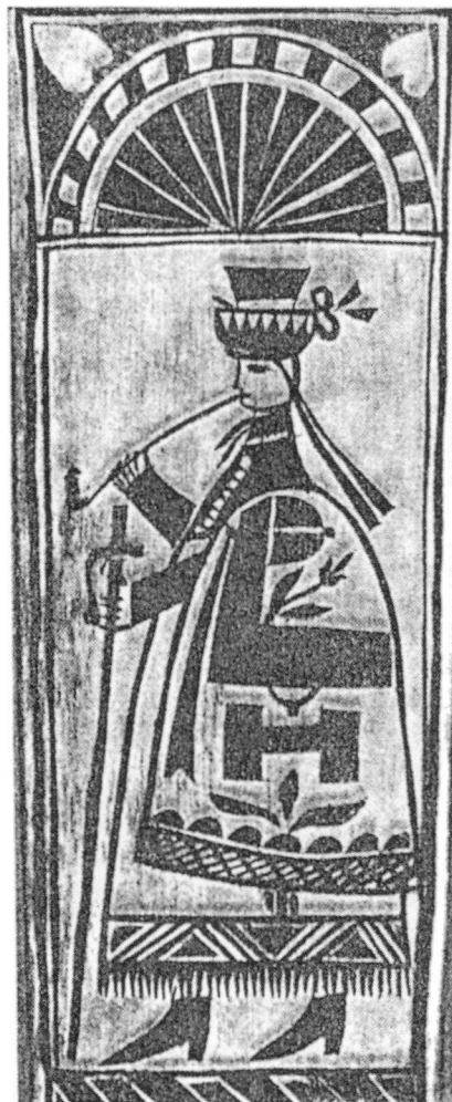
Borotvatok fedele, Szentgál, 1842; Bosnyák Sándor (1975)