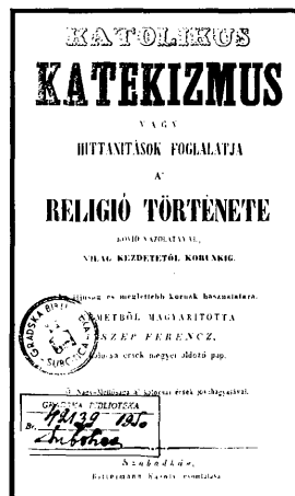
Szép Ferenc négy munkája: Bács vármegye év-századai (1837), Katolikus katekizmus (1846?) Szabadkai Naptár az 1847. évre (1846), A gyümölcsfa tenyésztés és nemesítés okszerű módjai (1847)