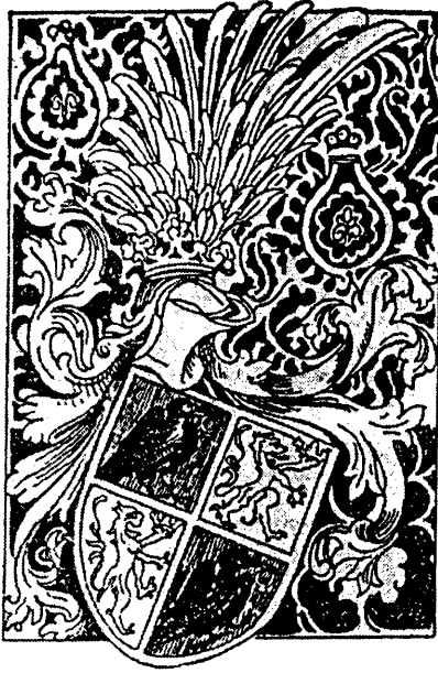
A Hunyadiak címere