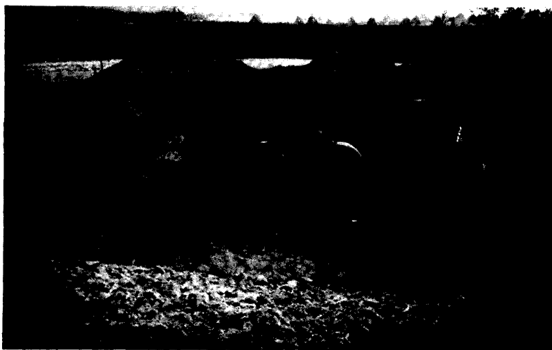
A tavankúti ásatás 1967-ben