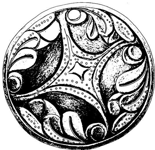
A törökkanizsai hajfonatkorong