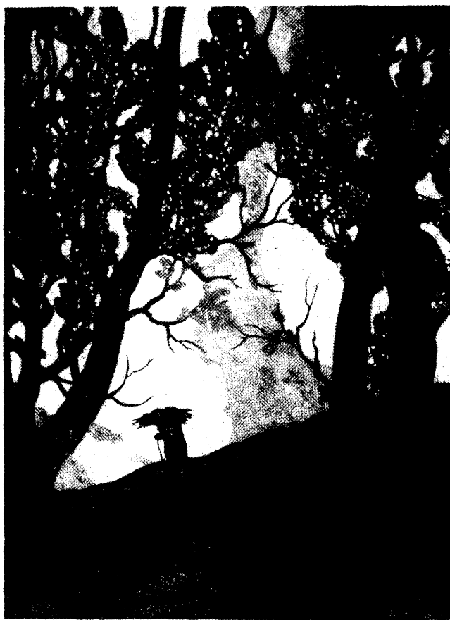
Farkas Béla: Rózsét gyűjtő asszony, 1930

kön kirepülnek a nagyvilágba, és szabad emberek lesznek. A szabadságban azonban meggyalázzák őket, veszélyeztetik az életüket. . .”