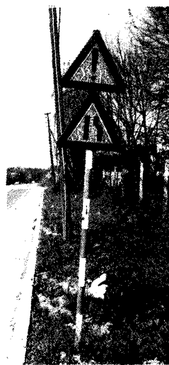
IVAN KOŽARIĆ: Triptichon , 1989–90