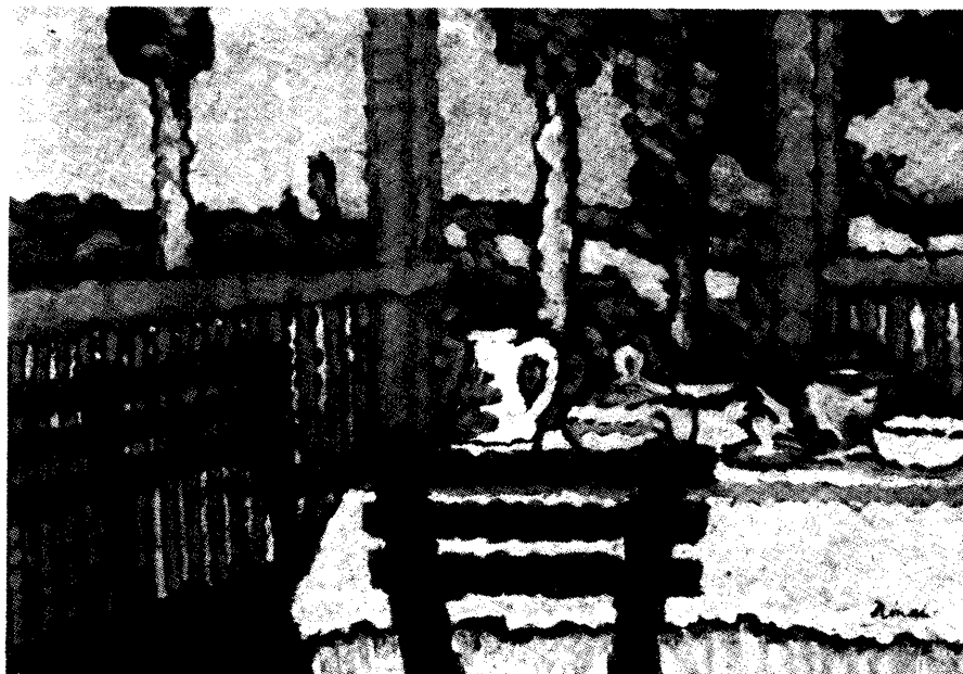
Rippl-Rónai József: Terasz

tottak. A kiállításon Rubovics Márk nálunk népszerű zsánerképeivel szerepel, de ott van Festők a Dunán című képével a magyar modern festészet jelentős egyénisége, Szőnyi István, továbbá a népszerű Spányi Béla is. Thorma János Hazafelé című képe a nagybányai művésztelep alapító tagjának minden jellegzetes ismertetőjeleit magán viseli. Szász Endre Megkínzott című grafikájáról ráismerhetünk a szürrealista grafikus és illusztrátor kézjegyére, de a másik kiállított kép, a Vadkacsavadász dilettáns kézművesmunka, egész biztosan hamisítvány. Az alföldi festők jeles képviselőjének, Tornyai Jánosnak az Erdei tisztás c. képe a gyűjtemény legértékesebb darabjai közé tartozik. A Székely Béla-tanítvány és a Hollósy-kör tagja, Vaszary János légiés A teraszon és A parkban című akvarelljei is a festő legjobb munkái közé tartoznak, s újfent meggyőződhetünk róla, hogy szerzőjük nem véletlenül volt egyaránt kedvence a műértőknek és a nagyközönségnek. Úgy érzem, ebből a felsorolásból nem maradhat ki Mednyánszky László, Rudnay Gyula, Kernstok Károly, Márfy Ödön, Bernáth Aurél, Berkes Antal, Pataki László, Iványi-Grünvald Béla, Herman Lipót, Krusnyák Károly és Eisenhut Ferenc neve sem.