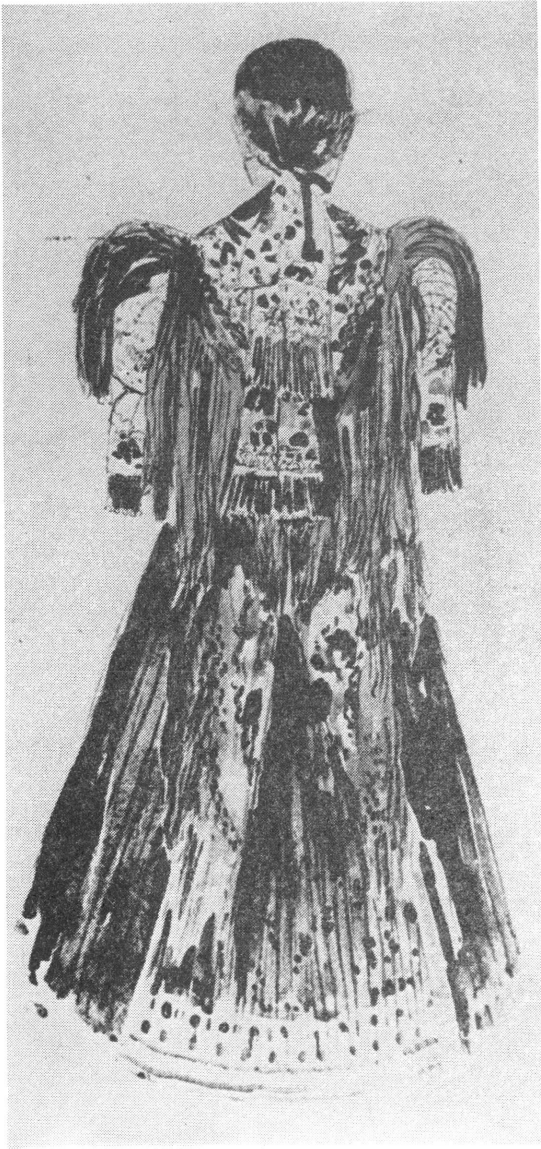
Mezőkövesdi népviselet (akvarell)