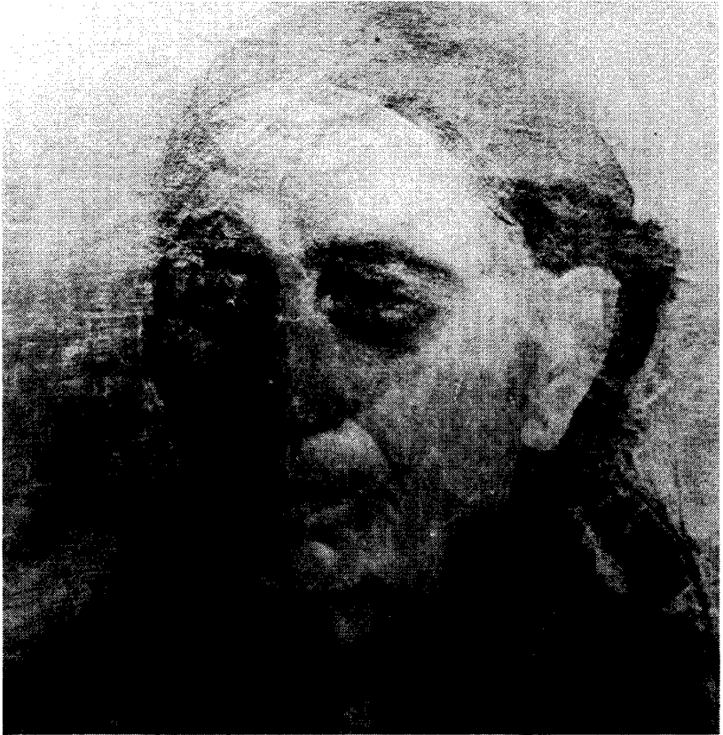
Juhász Árpád: Portré

Juhász Árpád a művészteleppel együtt mérült feledésbe, s neve a telep „rehabilitásával”, értékeinek „felfedezésével” bukkant ismét elő több évtized után. Műveit számba vették, ezeket az utóbbi évtizedben több kiállításon bemutatták, életpályájáról, gödöllői éveiről tanulmány jelent meg, szaporodott azoknak a publikációknak száma, amelyek valamilyen formában említést tesznek róla. Az „utóélet” fontos dátumának ígérkezik az 1988 derekán Zomborban és Szabadkán megrendezendő kiállítás, amely 85 év után az első önálló tárlata lesz.