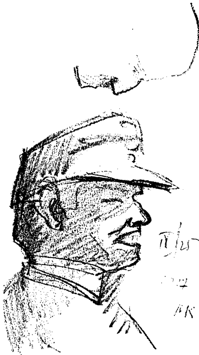
Fej profilban, 1918. IV. 25.