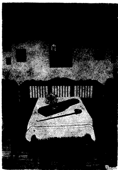
A hátsó szoba