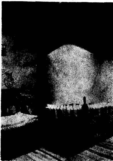
A hátsó szoba részlete búboske- mencével