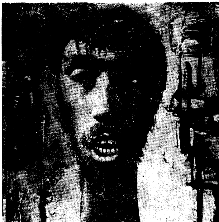
Faragó Endre: Fej (tanulmány)

szemű, amelyen egy gyermekkori rémálom villan fel, riadság és kíváncsiság ötvöződik. Az 1958-ban rendezett, második kiállítása már érett festővé avatja: Sáfrány Imre és Vinkler Imre is elragadtatással ír a Madárfészek a pusztaságban , a Félelem , a Temetés , az Esti találkozás , a Téli táj , no, meg a már akkori szőnyeg iránti érdeklődését bizonyító Szőnyegszövők című képeiről. Gesztusa immár szabad, képei szinte egy lélegzetre készülnek, elvetett minden kötöttséget — hangoztatja, tegyük hozzá, joggal, a kritika.