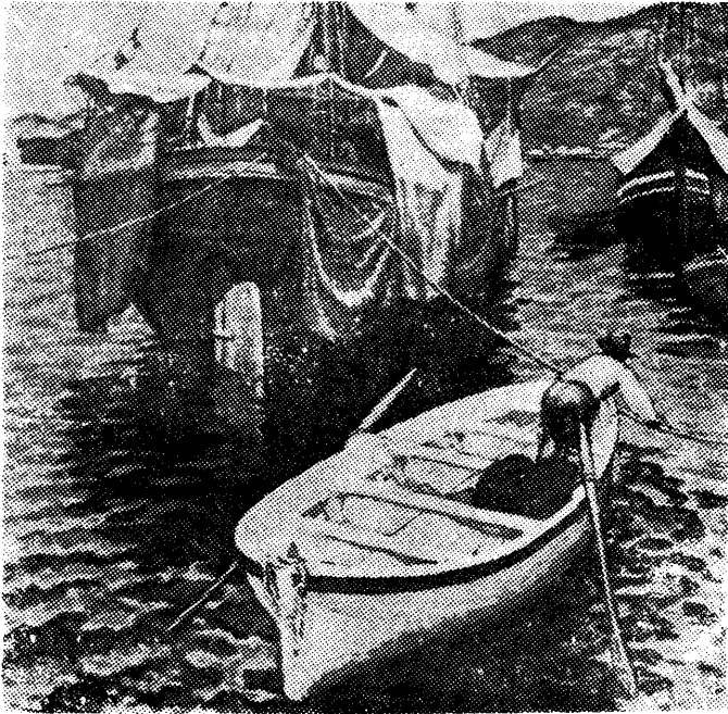
Pechán József: Gruzs (Gruža), 1911

a városban forradalmian új művészcsoport alakul, amelynek tagjai kezdetben keresőknek nevezik magukat. 1911-ben veszik fel a Nyolcak 22 nevet, s így válnak ismertté mint a századelő legjelentősebb művészi mozgalmának csoportja. Három kiállításuk volt: 1909-ben, 1911-ben és 1912-ben, ezt követően a csoport feloszlott, de a tagok legnagyobb része ismét találkozott 1919-ben, a Tanácsköztársaság idején.