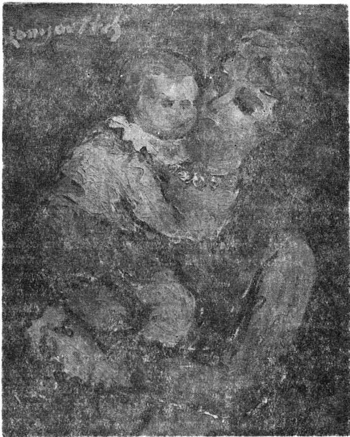
Anyaság, 1931, olaj, 81×65

ja, sőt innenső sem már. Szorosan egymás mellett úsztak, rövid csókokkal biztatták egymást. Szólniuk nem kellett, ugyanazt gondolták, csak kétféleképpen. Tudták, hogy nincs többé part. Csak örvény van, amely végképp egybesodorja, s végül lehúzza őket a mélybe. Tudták, hogy nincs már messze. Nem is úsztak már, csak csókolták egymást. Végző vágy és ajzottság feszítette mindkettőjüket. Olyan, amilyen egy utolsó csók, egy legutolsó szeretkezés lehet, mint a földrengés, lávaömlés, hogy végül egy kiégett világ csupán, vagy minden a régiben, csak ők ketten nincsenek már, ami egyre megy.