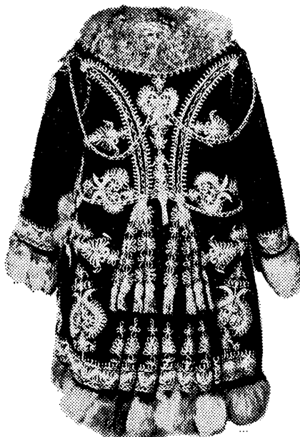
Suba, Uzdin, 1920-ból