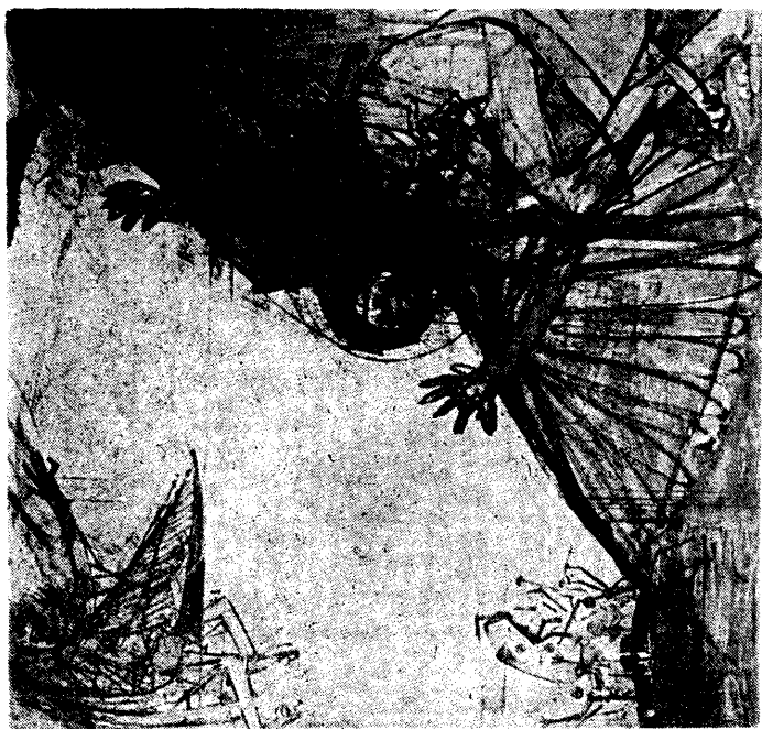
Bukás (Szt. Antal megkísértése)

A Juhász Ferenc Tékozló országa ihlette Dózsa Györgyről készült rézkarc sorozatával diplomált 1956-ban. Műtermet kapott, megnősült, majd rendes katonaidejének letöltésére jelentkezett, készen arra, hogy a katonaság után átadja magát a képzőművészeti „missziónak” — mert már kezdetben sem tartotta úgy, hogy tanulmánya befejeztével foglalkozást szerez; számára a festészet mindig is morális tett volt. Amit a háború alatt az érzékeny lelkületű kisfiú főként képzeletben élt meg, most az érett férfi, az iskolázott festő és grafikus a saját szemével láthatta. Addig úgy karcolt a tűvel a bronzlapra, hogy a magyar parasztlázadás kavargó vízióját a fantáziája táplálta; eszközeit pedig Rembrandt, Dürer és Hieronimus Bosch tanulmányozásával szerezte meg. Most, miközben Bosch fantazmagóriái, Dürer apokalipszisének lovasai lebegtek a szeme előtt, megelevenedtek előtte diplomamunkájának lapjai is: a rembrandti tökéletes fény-árnyék hatásokot a félelemtől, szorongásoktól terhes valóságban tapasztalhatta. Valószínű, hogy sokkoló élményei is közrejátszottak abban, hogy állandó témájának az ember kín szenvedését választotta, s hirdette, hogy az ember a szenvedések, a keresztre feszítés, a jó és rossz, a remény és a reménytelenség, ironia