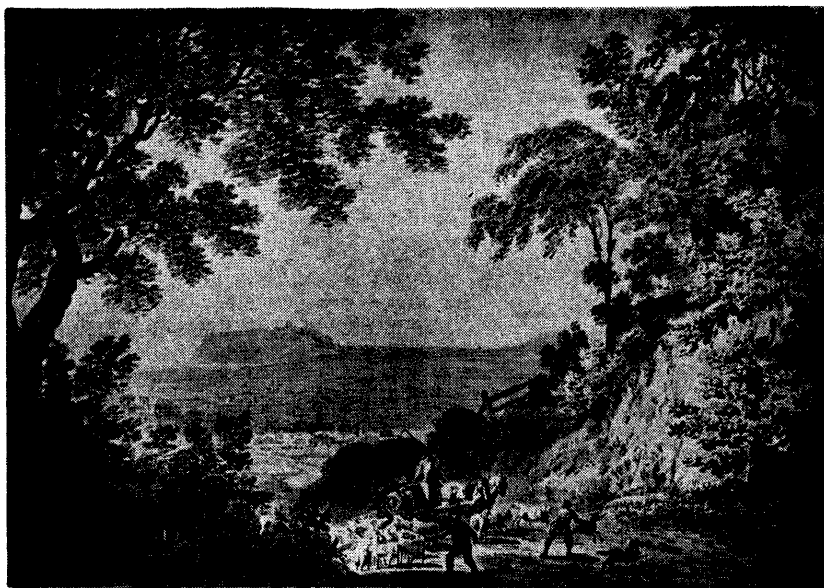
Francis Nicholson: Scarboro, 1793

kastélyt látunk. A szürke tónusok a „szigorú valóságot”, a puritán életet jelképezik, de az egyszínűség és a viharos ég fenyegetését érezzük, s ezen keresztül a bűnökkel terhes életet is sugallhatja.