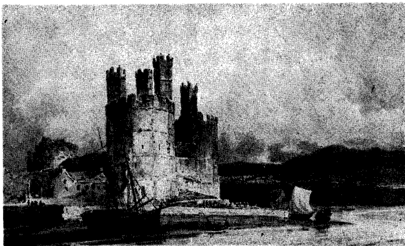
Thomas Girtin: A caerwoni kastély, XVIII. sz.

kastély. A fátyol koloritja érdekes: a föld barnáitól az ég kékjei felé közelít. Az érzelmi hangulat békés nyugalmat áraszt. A „nép és a főurak között” a szenvedélyes érzelmek föloldódnak, ez a boldog Britannia nemesi kereskedelmi osztályának az érzelme... A víz partján, az előtérben parányi emberek, mállás öszvérekkel vonulnak ki jelképesen a XVIII. századból. Ma bennünk más asszociációkat ébreszt a tájkép. Santoyana szerint az asszociációk „holdudvarát” teremti meg, hogy nagyobb távolságból egységben lássuk a múltat. Ő az, aki a topografikus festésmóddal „engedményeket tesz”. Nála a körvonalak lazulnak, szinte fölszakadoznak. A belső szemlélet még szigorúságra hajló — a külső világ azonban szabadulást kívánó. Ez a puritanizmus és a szabadelvűség küzdelme, amely érdekes, gazdag formákat szült vagy hozott létre. A szabadelvűség, a párás lég szétszórt fénye által nyilvánul meg. És mint lehetőség, a képzeletet serkenti.