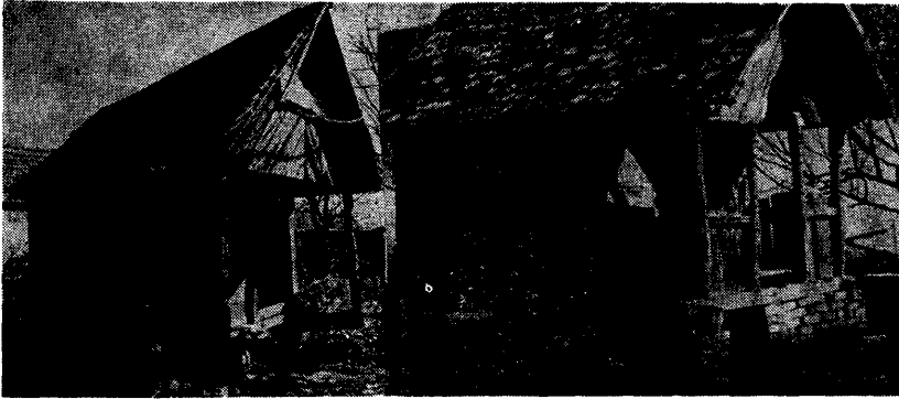
Mozdítható és rögzített hambár

az egykori hálókamrás megoldásokat is. A különböző formákat elemezve, azt kell mondani, hogy a célszerűség mellett nemegyszer az esztétikai érzék is kifejezésre jutott. Érzékkel építettek népi építőink, ez nem lehet vitás.