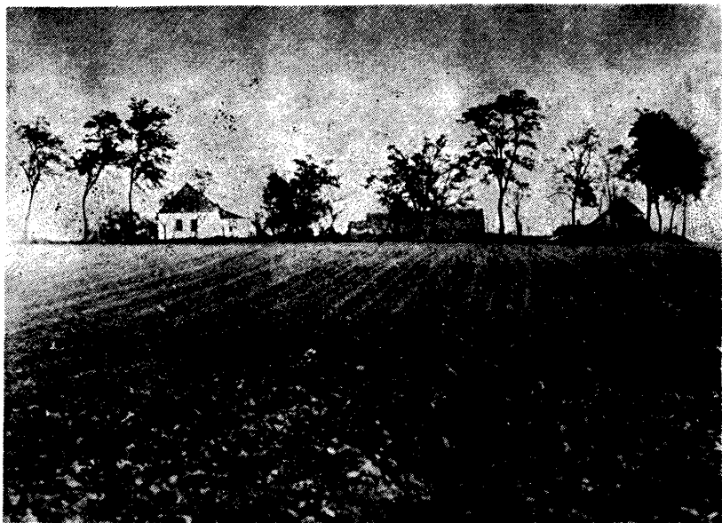
Jellegzetes györgyéni szállás

A szállásiak életét az apa szervezte meg. Szava szent és sérthetetlen volt, mindaddig, amíg szenilis nem lett. Az ő feladata volt, hogy mindent felmérjen és mindenről bölcsen döntsön.