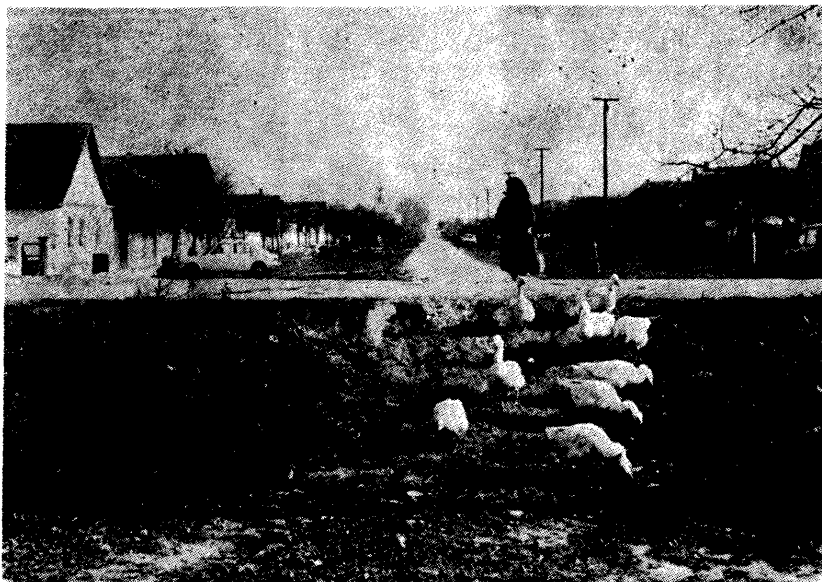
A jellegzetes széles utca — Bácsmonostor

A változások előbb a patriarkális nagycsaládszervezetet bomlasztották fel, ma pedig már annak vagyunk tanúi, hogy a szállási világgal eltűnőben van e népi építkezés is. Pedig, mint láthattuk, mennyire a dolgok logikus menete és a szükséglet alakította ezeket a formákat.