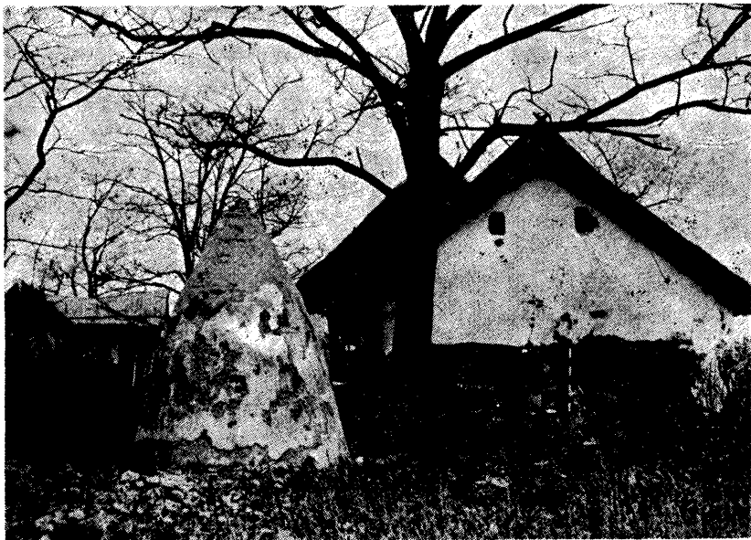
Kúp alakú tyúkól egy šupljaki szálláson

lyek szülőházát vagy pedig jeles történelmi események színhelyét restauráltuk. A tartományi területi műemlékvédők megannyi hasonló emléket regisztráltak és ajánlották megvédésüket. A szabadkai Műemlékvédő Intézetben például sok napsugaras oromzatot evidentáltunk: Staponon hambárok, Béregen gyönyörű tájházegyüttest regisztrálhattunk. Bácsmonostoron pedig még ma is működő mészegetőt. Nemrégiben jelent meg Harkai Imre topolyai kutató Temerin népi építésze című könyve, amely ugyancsak felhívja a figyelmet a község tájházegyütteseire, „kiblikre”, azaz érdekes és jellegzetes oromzatokra és gazdasági épületekre. Itt még találtak szétbontatlan mezei téglaegető kemencét is. A megőrzött nagyobb egységek közül viszont említsük meg a szerémségi Kupinovo etno-parkot, amely sajátos állati és növényi rezervátum lett.