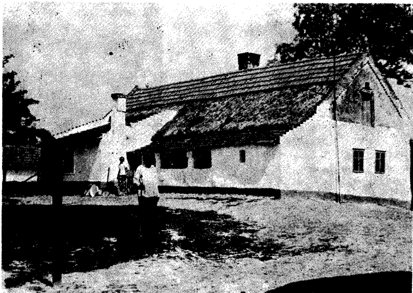
Tornácos-ámbitusos ház Palics környékén

biztosította. Valamikor ez volt a béresi ház. Itt a béres élt családjával.