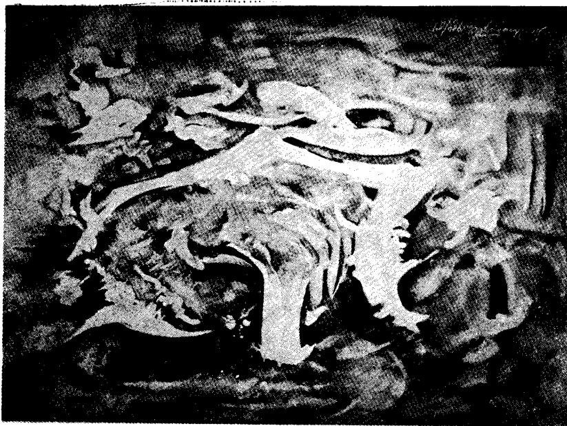
Milivoj Nikolajevič: Fehér-szürke haláltánc 1980—81

bizonyos „adagban” mindig jelen van alkotásaiban. Konstitucionális eleme ez művészetének. Ami paradoxális: annyira tökéletes a technikája, hogy a játék könnyedségét juttatja eszünkbe, de művészete mégsem játékos, hanem éppen ellenkezőleg, némelykor tragikus hangú. Erre érdemes külön felfigyelni. Az úszó ágak szabálytalan vonalaiból alakította ki absztrakt informeles formáit. Elve a jelen időért való küzdelem, ami nem más, mint a változtatás akarása és a szembeszegülés „megtörténése”.