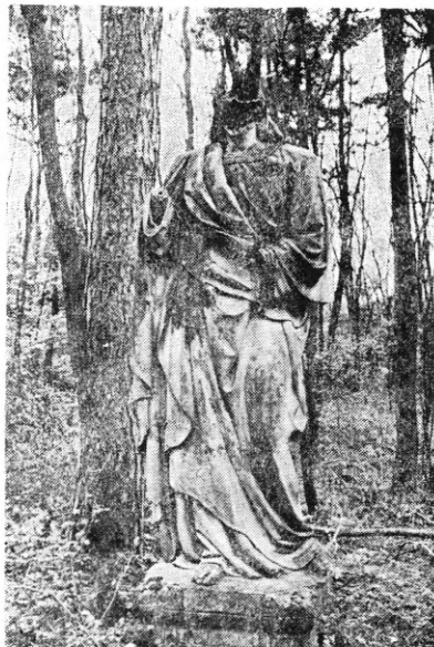
Az összetört szobor