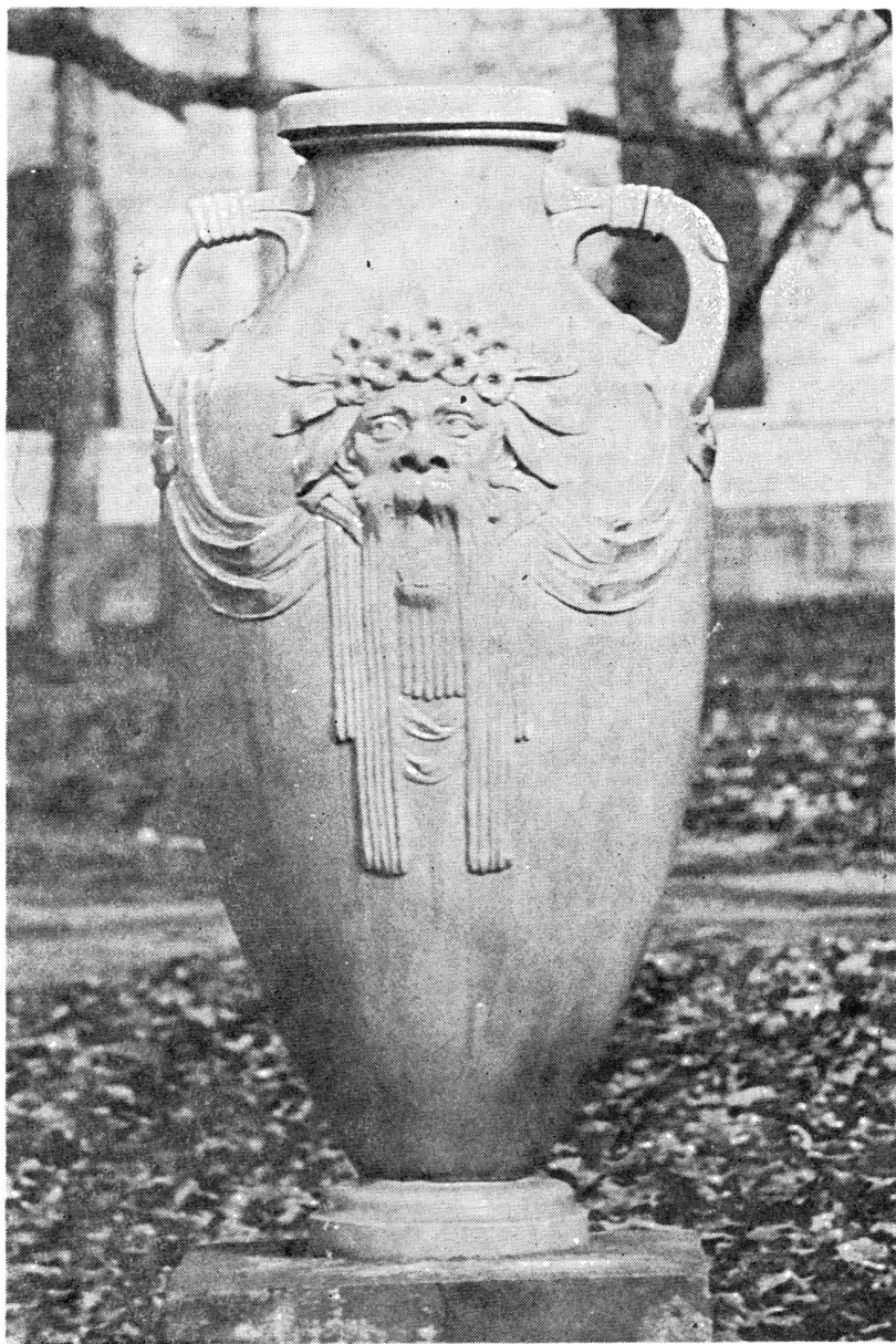
Zsolnay „kék váza” Palicson