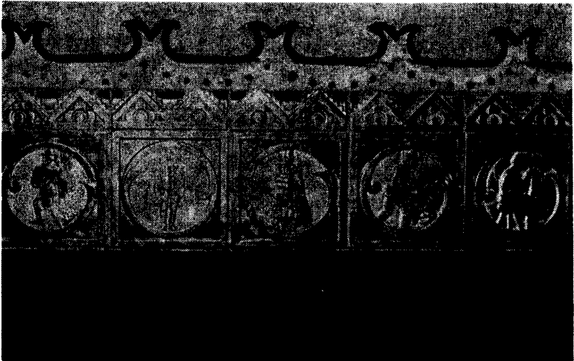
A szabadkai városháza Zsolnay-eozinlapjai

mányait Bécsben végezte 1876 és 1881 között, ezt követően pedig a Fellenner-Helmer műterembe került. Később együttműködött Fridrih Smidttel, akinek szintén vannak épületei Horvátországban (a zágrábi Tudományos Akadémia épülete, amely 1880-ban készült el, és az 1892-ben befejezett djakovói székesegyház). Vancas működésére az eklektikus stílus jellemző, de a szecesszió sem áll távol tőle. Termékeny alkotótevékenységének Boszniában lehetünk leginkább szemtanúi, de jelentős épületeket emelt Ljubljanában, Zágrábban, Eszéken és más városokban is. Az általa tervezett szarajevói neogótikus katedrális (1884—1889) Zsolnay-tetőcseréppel fedték. Mivel, a szarajevói helytartósági épület és más épületek díszítőkerámiáját is a Zsolnay-gyárnak tulajdonítják, érdemes volna Vancas tevékenységét a Zsolnay-gyár dokumentációs anyagában is nyomon követni! Vancas 1883 és 1921 között 102 lakóházat, 70 templomot, 12 iskolát, 10 bankot, 10 palotát, 10 helytartósági és hatósági épületet, 6 szállodát, vendéglőt épített Boszniában. Jelentősebb építményei közül megemlíthetjük az Union Szállót, két ljubljanai és a zágrábi Takarékpénztárat (1898—1900), valamint az eszéki Normann-palotát. Az ő műve volt Bosznia-Hercegovina Népművészeti Pavilonja is a milleniumi kiállításon (1896).