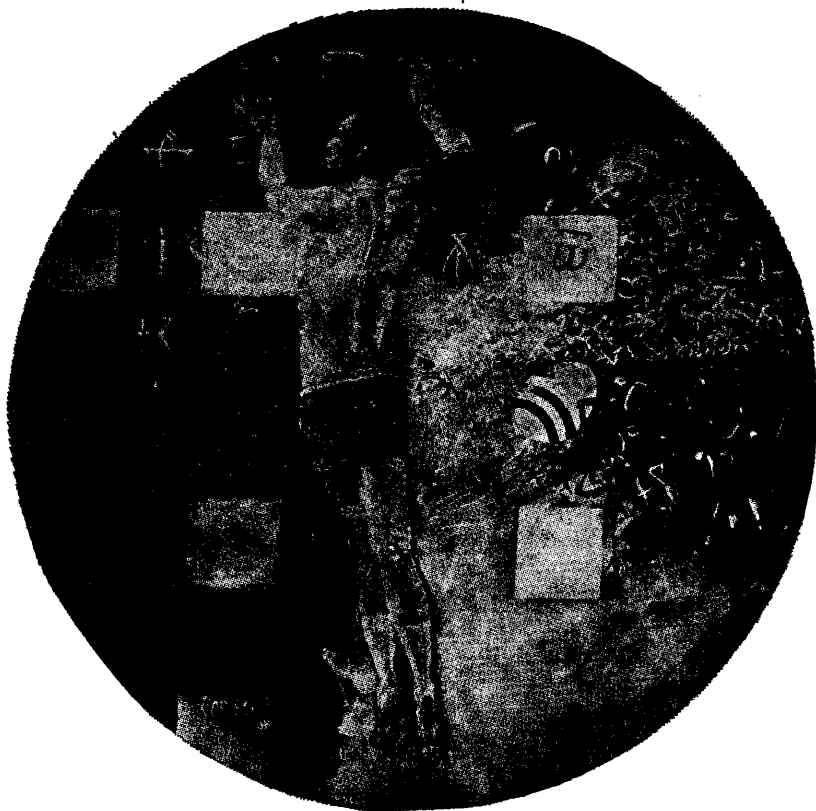
Mladen Srbinović festménye

ragyogják. Mert Srbinović világító felületei a szó szoros értelmében izzanak. Néha az embernek az a benyomása, mintha egy mesterséges fényforrás világítaná hátulról a vásznat.