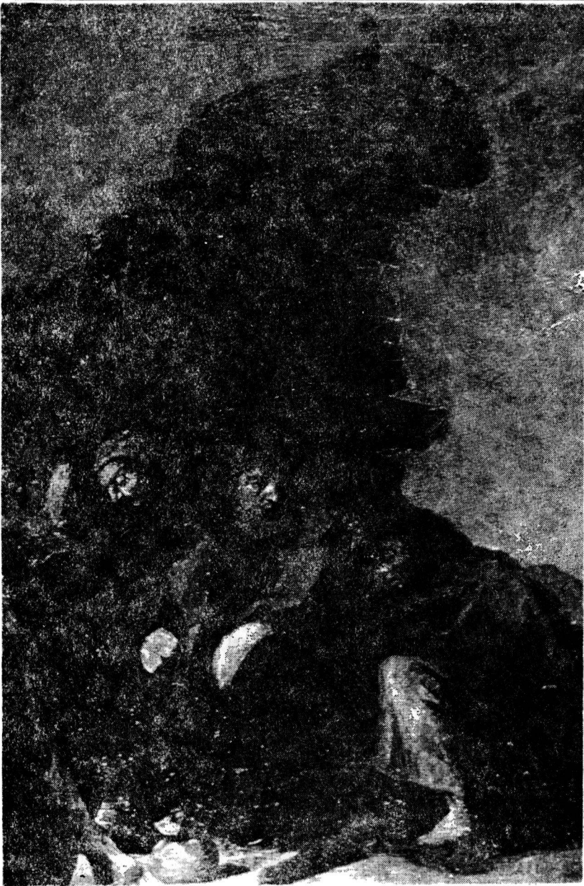
Pihenés a színek után, 1876. Olaj, vászon, 61×81 cm.