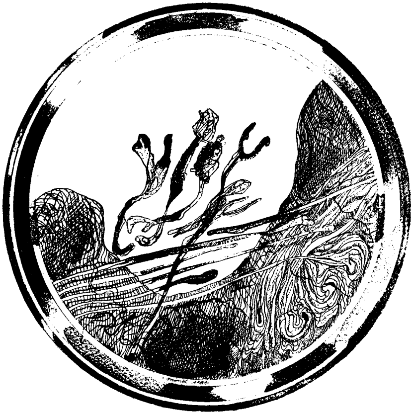
Maurits Ferenc szövegillusztrációja

mutatta be a közönségnek úgy, hogy következetesen ragaszkodott a keret egy meghatározott formájához, a körhöz. Franzer mester eleget tett ennek a kívánságnak. Persze nem csak ezért volt jó a Maurits kiállítás.