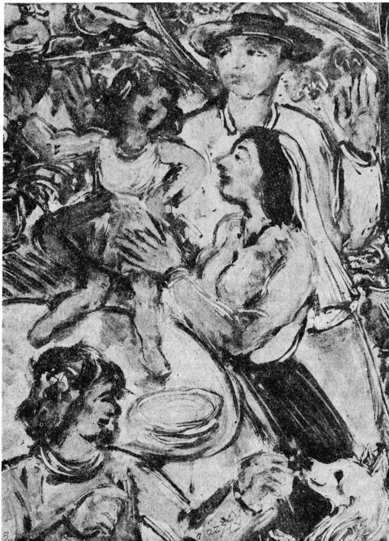
Cirkuszos család, monotípiá, 1940, 43x30