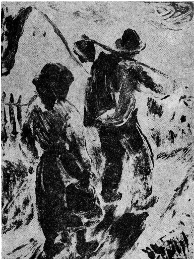
Hazafelé, monotipia, 1930, 30x23