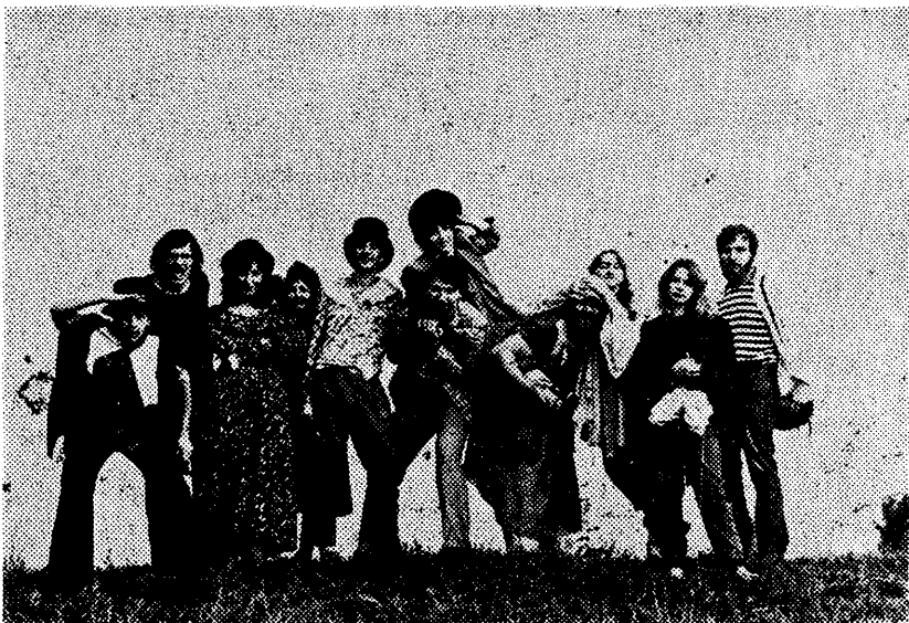
A Tanyaszínház társulata

A társulat tagjai nem győzik hangsúlyozni, hogy ez az összetartás, ez az együtt- és egymásért dolgozás a Tanyaszínház lényege, ez a legfőbb erénye, ez teszi annyira vonzóvá a számukra és ebben különbözik a leginkább a hivatásos társulatoktól, az úgynevezett nagy színházaktól. Itt nincs színész- és művészhierarchia, itt senki sem irigylti a másik sikerét, itt nem számít sértésnek, ha nem a primadonna kapja a legnagyobb tapsot, itt nincsenek primadonnák.