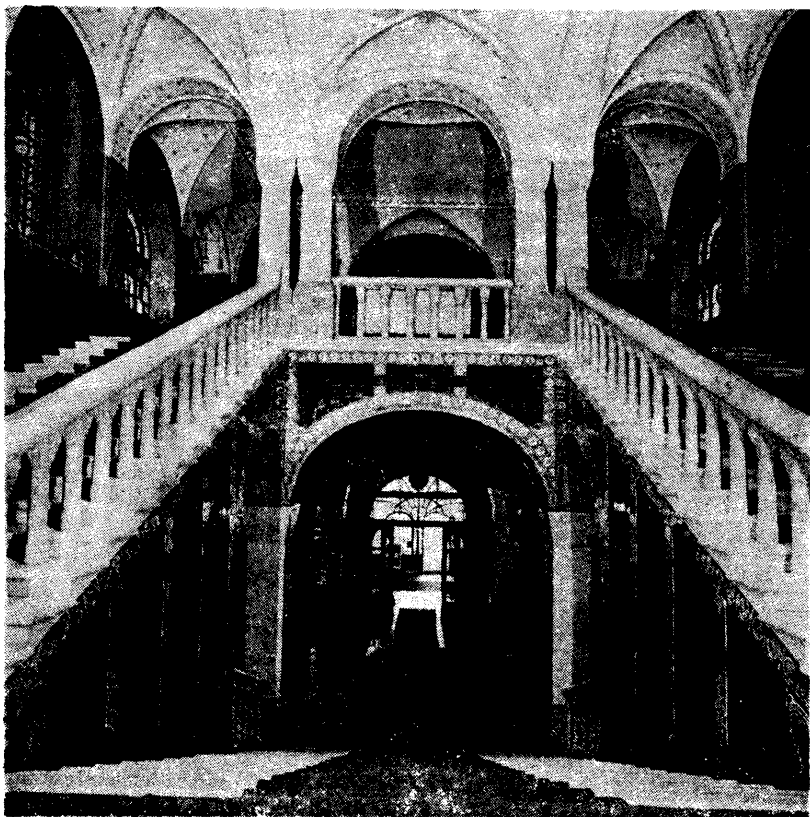
A városháza díszlépcsője

táraknak, a raktáraknak és az előszobáknak nincs közvetlen nappali megvilágításuk.